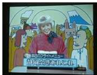
空港の説明ビデオを鑑賞。