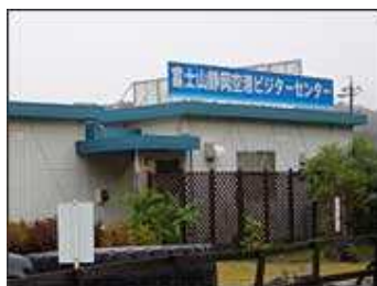
まずは、空港ビジターセンターに向かいます。

県内では、地元企業の鈴与(静岡市清水区)が航空事業への参入を決めたり、客室乗務員を養成する専門学校の開校や、航空工学のエンジニア育成を目指す科の新設を検討する学校など、静岡空港の開港に向けた動きが、各方面で活発になってきています。